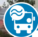
Schéma uzlu na straně 7. Jízdní řády na www.idsjmk.cz .

od 1. 8. 2018 bude zprovozněno zcela nově opravené autobusové nádraží v Blansku. V souvislosti s tím se mění jízdní řády linek odjíždějících z autobusového nádraží.