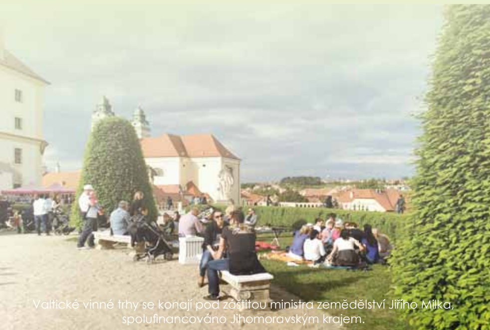
Valtické vinné trhy se konají pod záštitou ministra zemědělství Jiřího Milka, spolufinancováno Jihomoravským krajem.