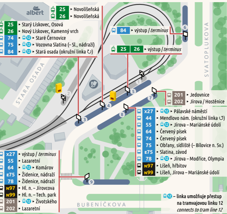
Schéma denních linek Daytime lines network