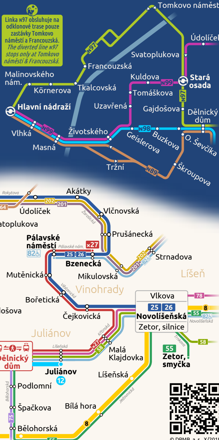
Schéma nočních linek Nighttime bus lines network

Linka N97 obsluhuje na odklonové trase pouze zastávky Tomkovo náměstí a Francouzská . The diverted line N97 stops only at Tomkovo náměstí & Francouzská.